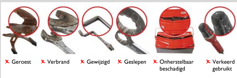
✗ Geroest ✗ Verbrand ✗ Gewijzigd ✗ Geslepen ✗ Onherstelbaar beschadigd ✗ Verkeerd gebruikt

Onderhoud en controle volgens de planning draagt bij aan de technische betrouwbaarheid van het schip. Mankementen kunnen tijdig worden opgemerkt en opgelost.